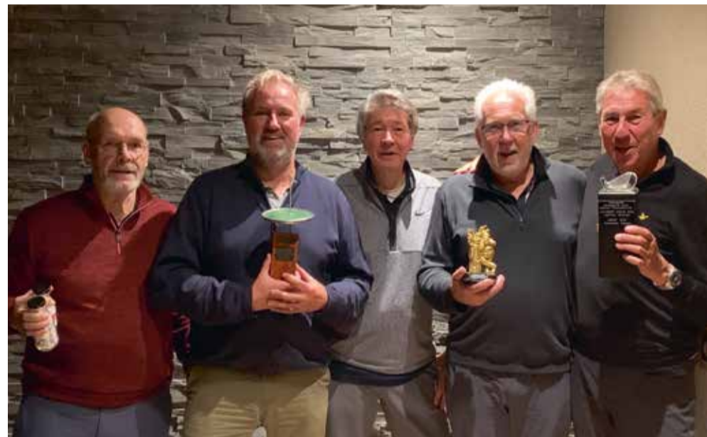
Namen winnaars van links naar rechts