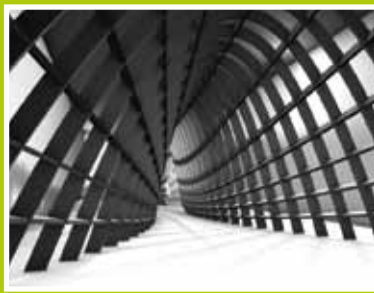
Nieuwe Vide binnenstebuiten pag. 3