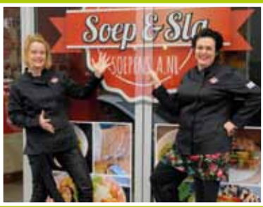
Stil je trek bij Soep en Sla pag. 2