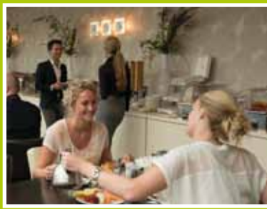
Slaap zacht aan de rand van de Waarderpolder pag. 2