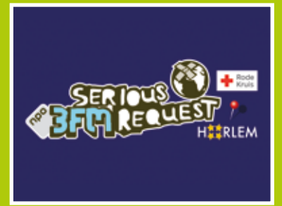
Serious Actions: acties voor en door bedrijven voor de stille ramp pag. 4