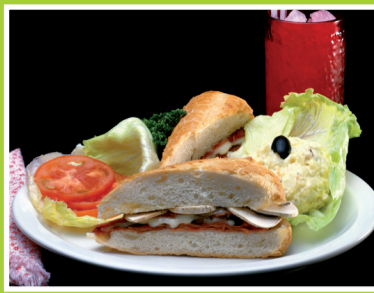
Smakelijke lunchaanbieding voor alle lezers pag. 3