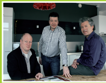
Waardervol stelt zich voor... pag. 4