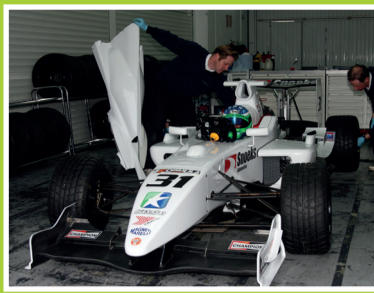
AR Motorsport brengt titels mee naar Haarlem pag. 2