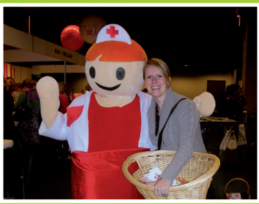
MedischGastOuder warme opvang voor kinderen pag. 2