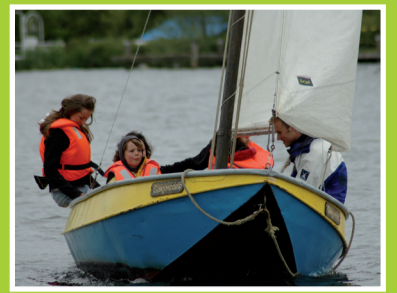
Bim-Baknessergroep oud-gediende in de polder pag. 4