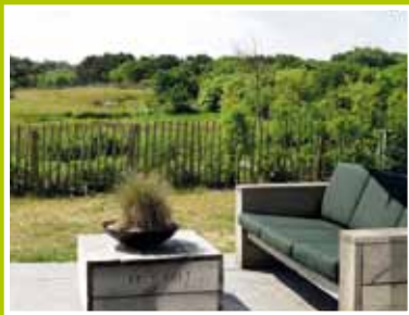
Reisjes boeken vanuit de Waarderpolder pag. 2