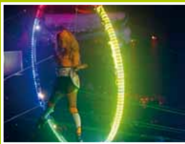
Inventeq: Techniek, mechanica en beweging pag. 3