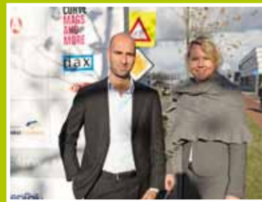
"Het is een uitgestrekt gebied met een goede mix van bedrijven" pag. 4