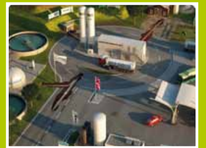
Groen Gas in de Waarderpolder pag. 4