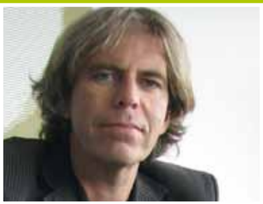
Made in Haarlem: alleen maar leuke klanten pag. 2